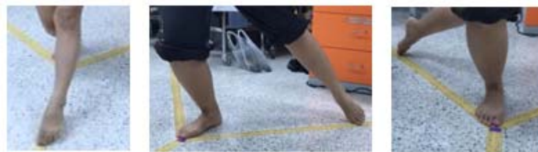
รูปที่ 1. ทดสอบการควบคุมการทรงท่าขณะเคลื่อนไหวทิศด้านหน้า (anterior; ANT) ทิศด้านใกล้กลางด้านหลัง (posteromedial; PM) และทิศด้านข้างด้านหลัง (posterolateral; PL)